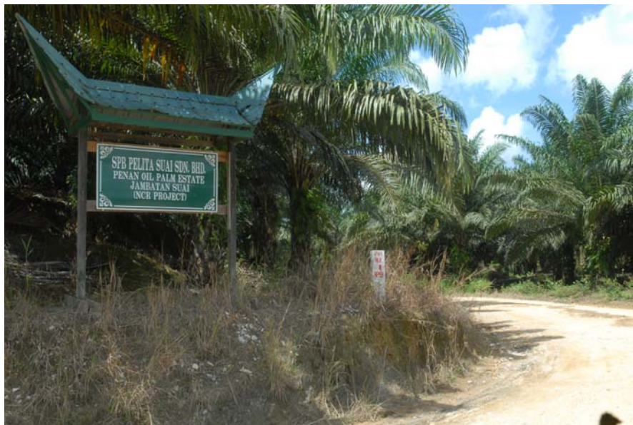
Gambar 16 : Ladang kelapa sawit milik masyarakat kaum Penan di Kampung Ugos, Batu Niah, Miri.