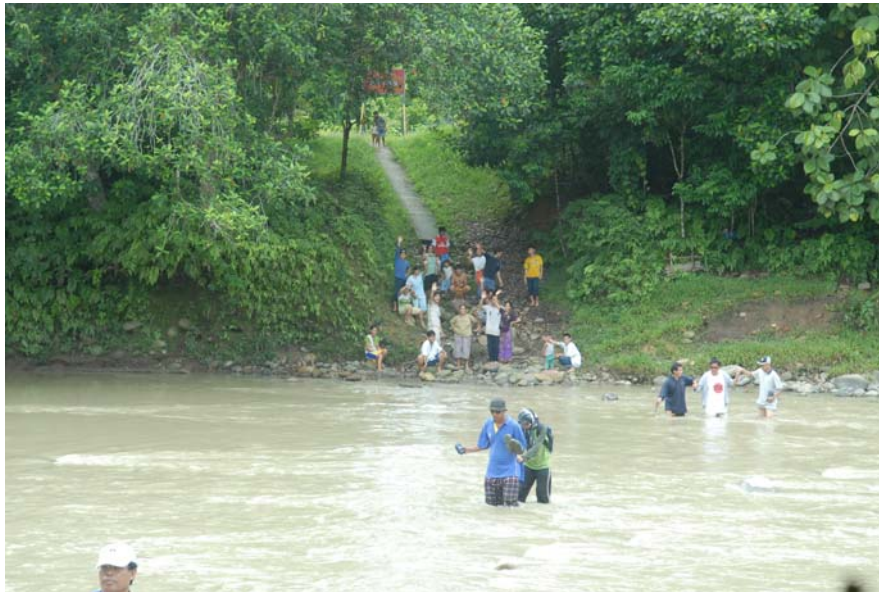
Gambar 1 : Tidak ada jambatan penghubung ke Kampung Long Item kecuali mengharung air sungai yang deras.