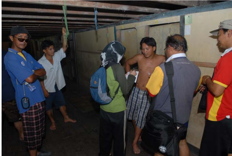
Gambar 23 : Temubual oleh pegawai dari Jabatan Pendaftaran Negara Negeri Sarawak di Long Item.