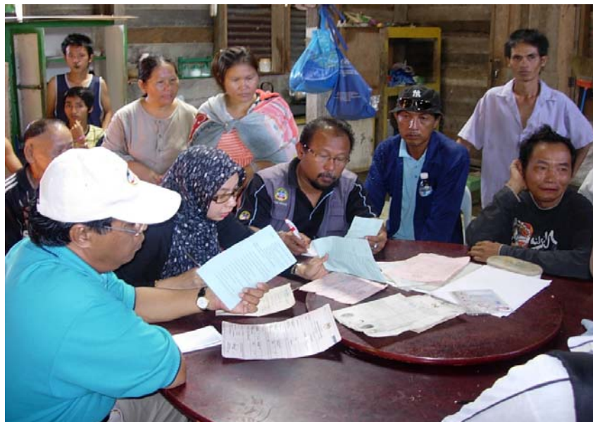
Gambar 24 : Proses semakan keperluan dokumen pendaftaran oleh pegawai Jabatan Pendaftaran Negara Sarawak dan Jabatan Kebajikan Masyarakat Negeri Sarawak.