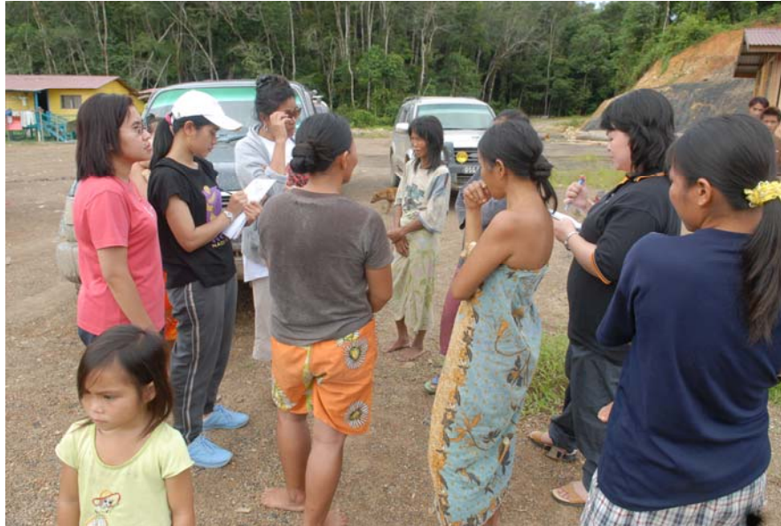
Gambar 20 : Temubual dijalankan antara Ahli Jawatankuasa dan kaum wanita Penan di Long Luteng.