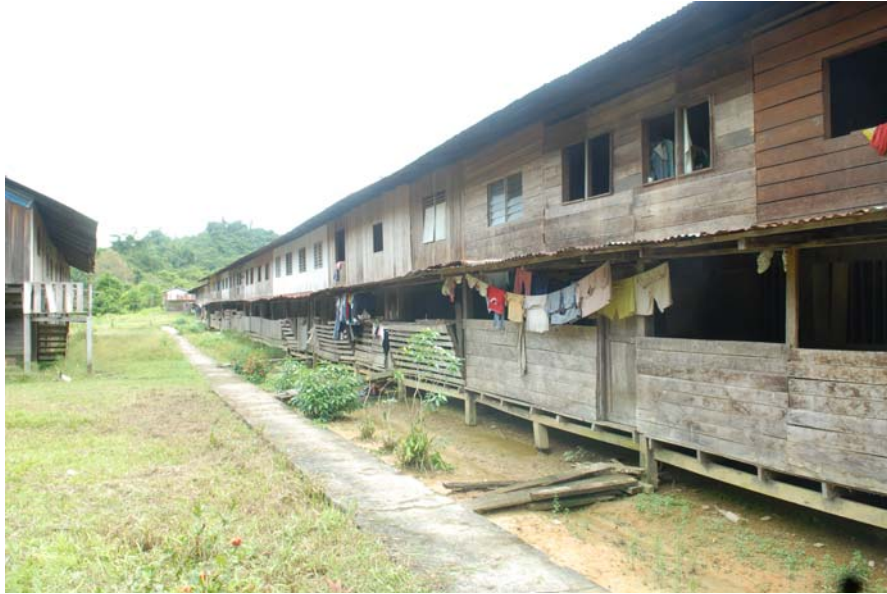
Gambar 2 : Keadaan dan pemandangan sekitar rumah panjang di Long Item.