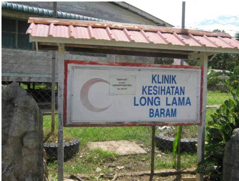
Gambar 25 : Papan tanda Klinik Kesihatan Long Lama, Baram.