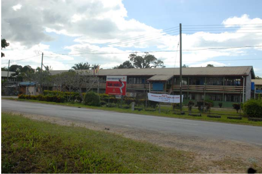
Gambar 17 : Sekolah Kebangsaan Batu Telingai di Kampung Suai.