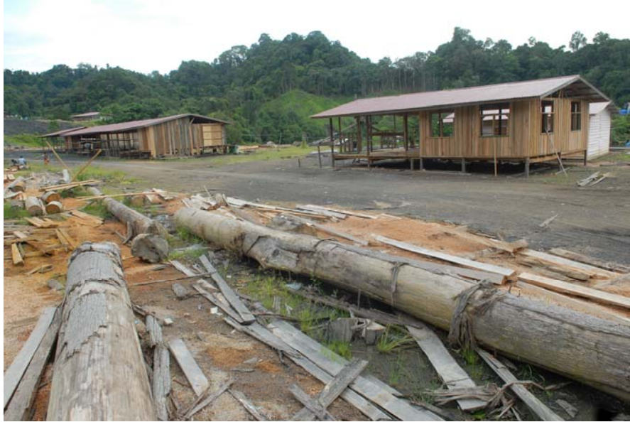
Gambar 9 : Rumah yang masih dalam proses pembinaan menggantikan rumah yang telah terbakar di Long Luteng.