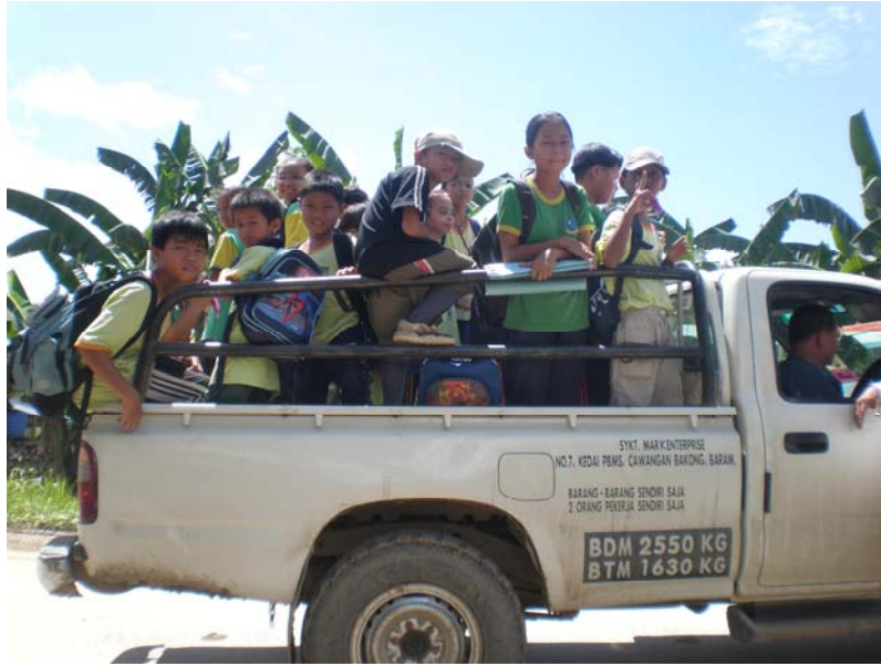
Gambar 28 : Sekumpulan kanak-kanak sekolah yang menggunakan perkhidmatan kenderaan pacuan empat roda untuk berulang alik dari rumah ke sekolah yang boleh membahayakan keselamatan mereka.