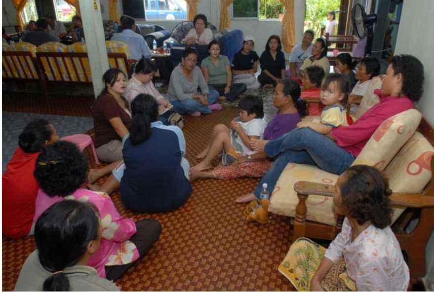
Gambar 22 : Sesi temubual dijalankan dengan sekumpulan wanita Penan di Kampung Ugos, Jambatan Suai, Niah.