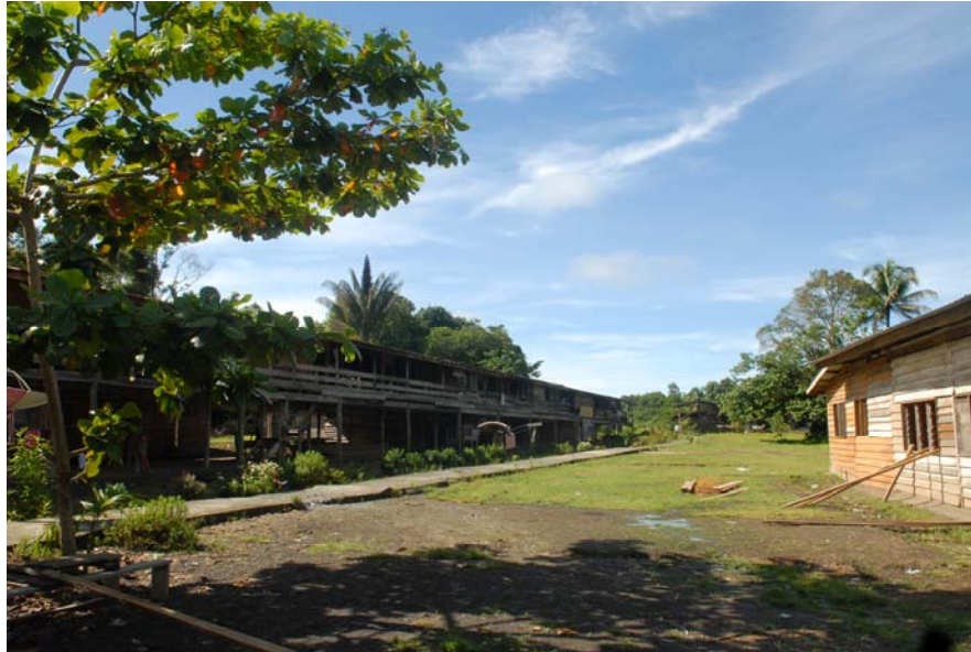
Gambar 10 : Kawasan di perkampungan Long Belok yang agak membangun dibandingkan dengan petempatan lain.