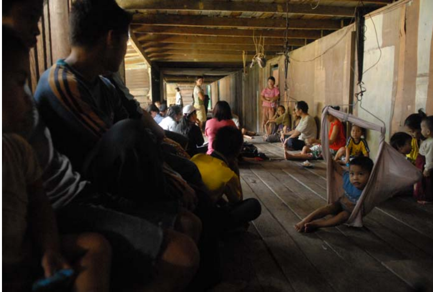
Gambar 19 : Temubual yang dijalankan oleh Ahli Jawatankuasa Bertindak dengan sekumpulan penduduk Long Item.

mungkin malu untuk mengadu dan bercerita tentangnya.