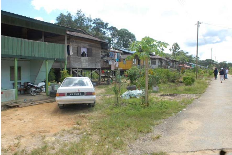
Gambar 15 : Salah sebuah rumah di Kampung Ugos.