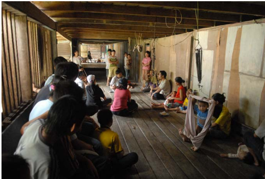
Gambar 3 : Temubual antara Ahli Jawatankuasa Bertindak dengan kaum wanita Penan di Long Item.