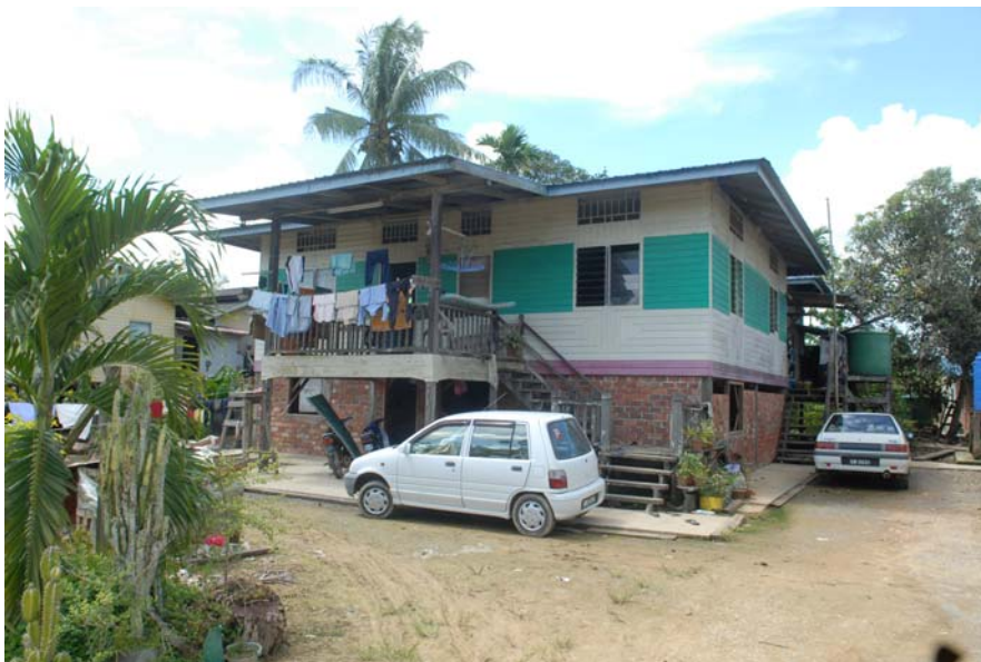
Gambar 14 : Salah sebuah rumah di Kampung Ugos.