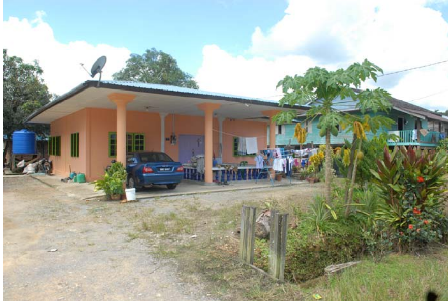
Gambar 13 : Keadaan rumah di Kampung Ugos yang sudah membangun.