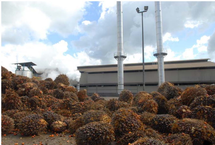
Gambar 18 : Kilang memproses kelapa sawit milik pengusah kaum Penan.