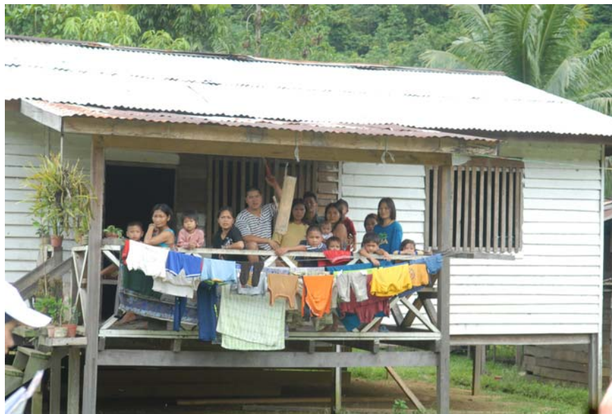
Gambar 6 : Rumah Ketua Kampung Long Kawi.