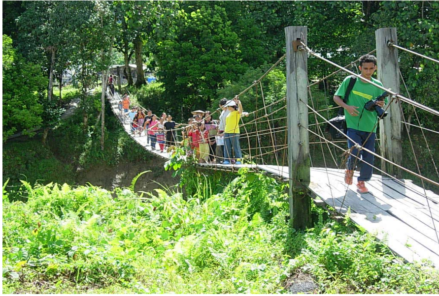
Gambar 12 : Jambatan gantung yang digunakan oleh penduduk Long Belok untuk berhubung dengan pihak luar.