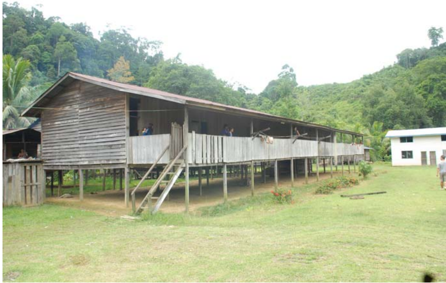
Gambar 5 : Rumah panjang yang terdapat di Long Kawi.