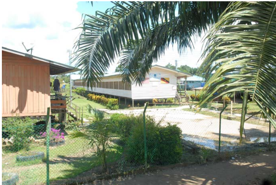
Gambar 27 : Pandangan dari luar kawasan Sekolah Long Lapok, Tinjar.