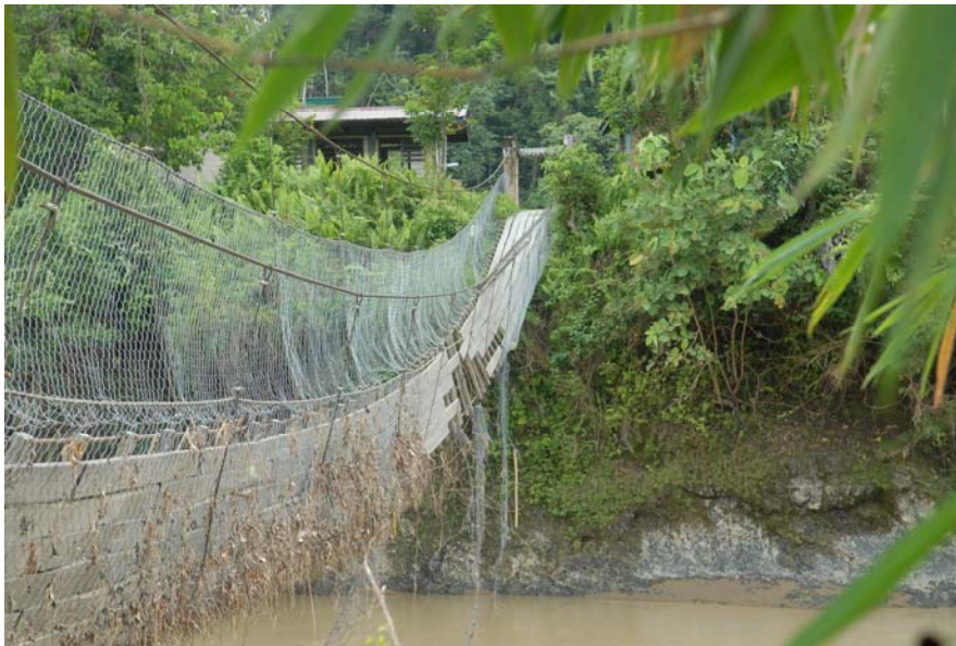
Gambar 8 : Jambatan gantung yang digunakan oleh kanak-kanak sekolah di Long Luteng yang telah rosak akibat banjir.