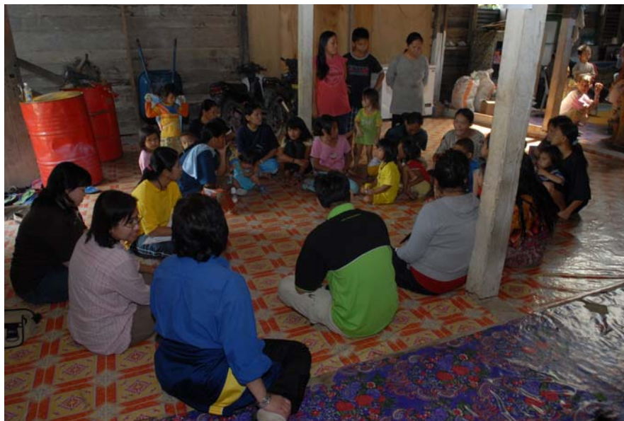
Gambar 21 : Temubual Ahli Jawatankuasa Bertindak dengan sekumpulan kaum wanita Penan di rumah Tuai Rumah (Ketua Kampung) di Long Belok.