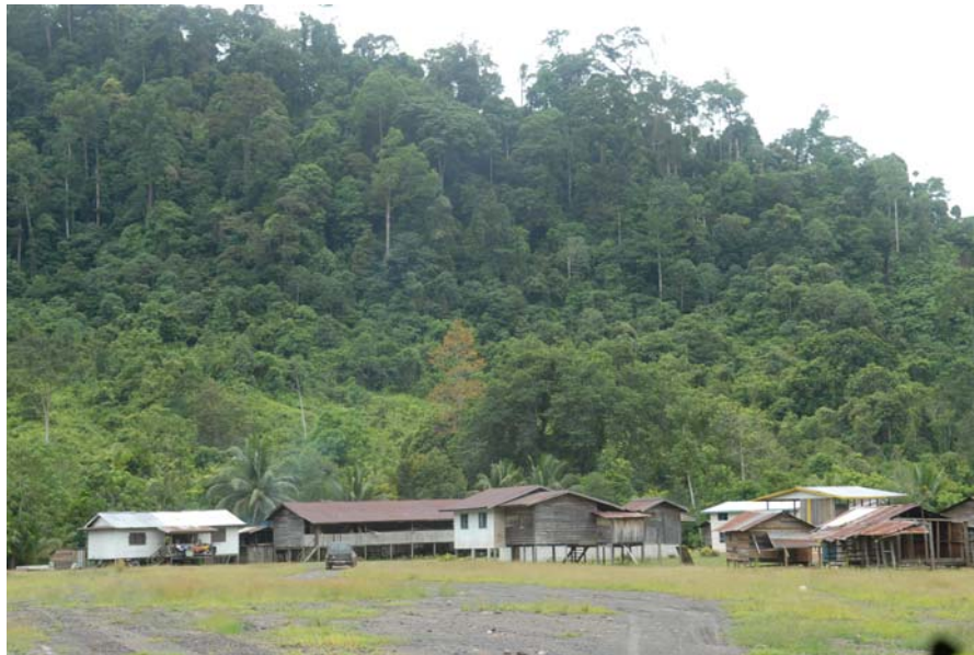
Gambar 4 : Kawasan Long Kawi di Ulu Baram.