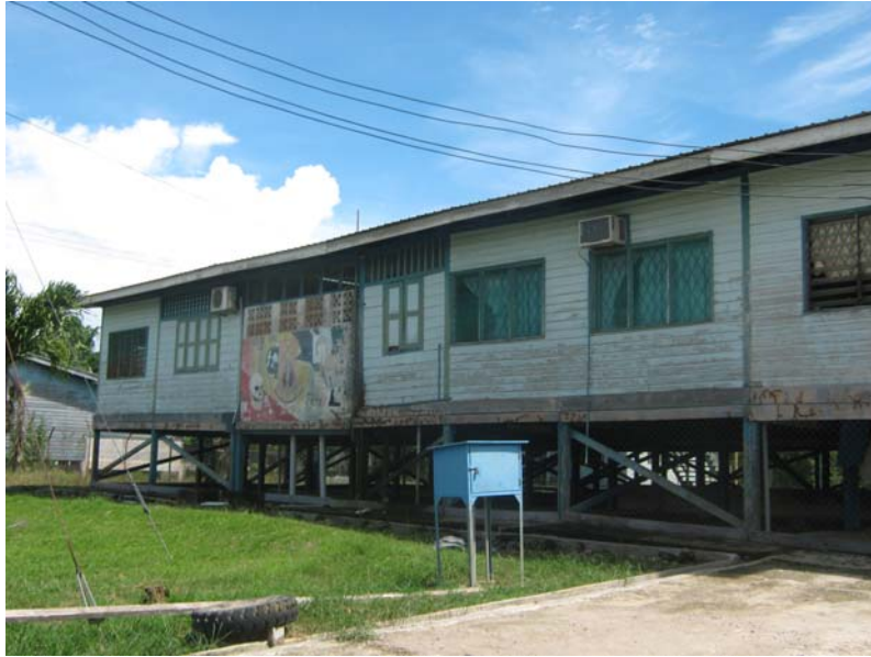
Gambar 26 : Pandangan dari luar Klinik Kesehatan Long Lama.