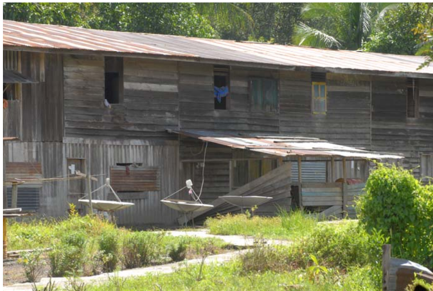
Gambar 11 : Kebanyakan rumah di Long Belok mempunyai para bola.