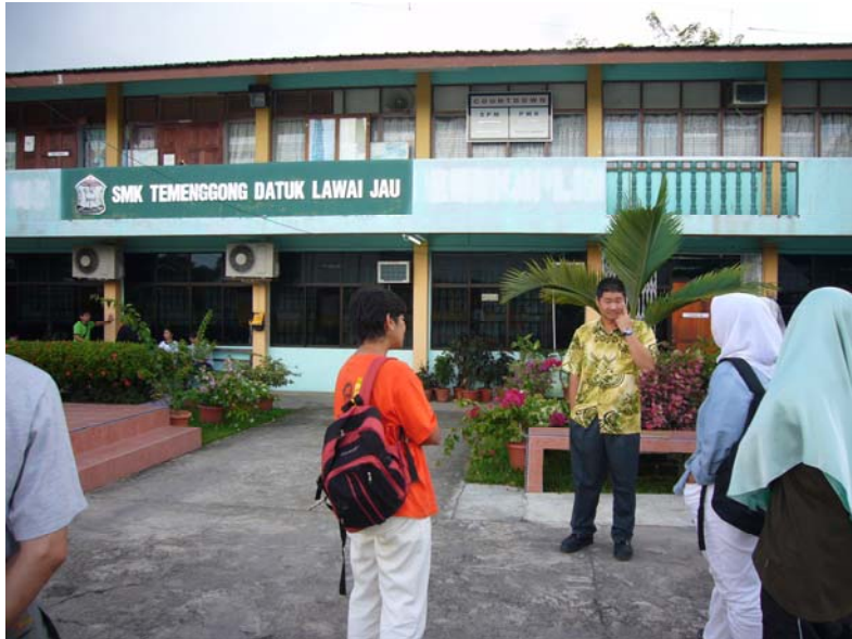
Gambar 29 : Sekolah Menengah Kebangsaan Datuk Lawai Jau.