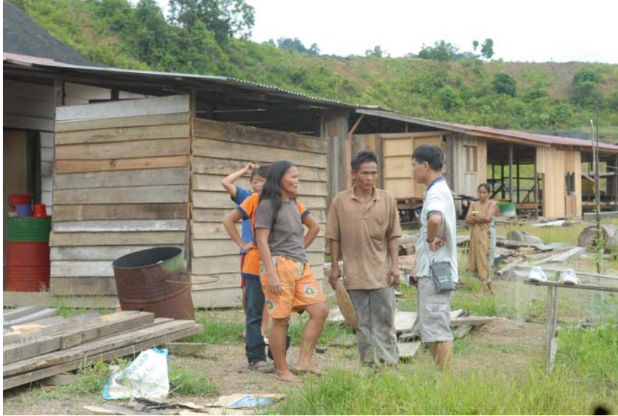
Gambar 7 : Penduduk di Long Luteng.